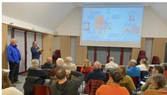
Dans l'assistance venue nombreuse, des apiculteurs et des particuliers du Trièves particulièrement intéressés par le sujet.